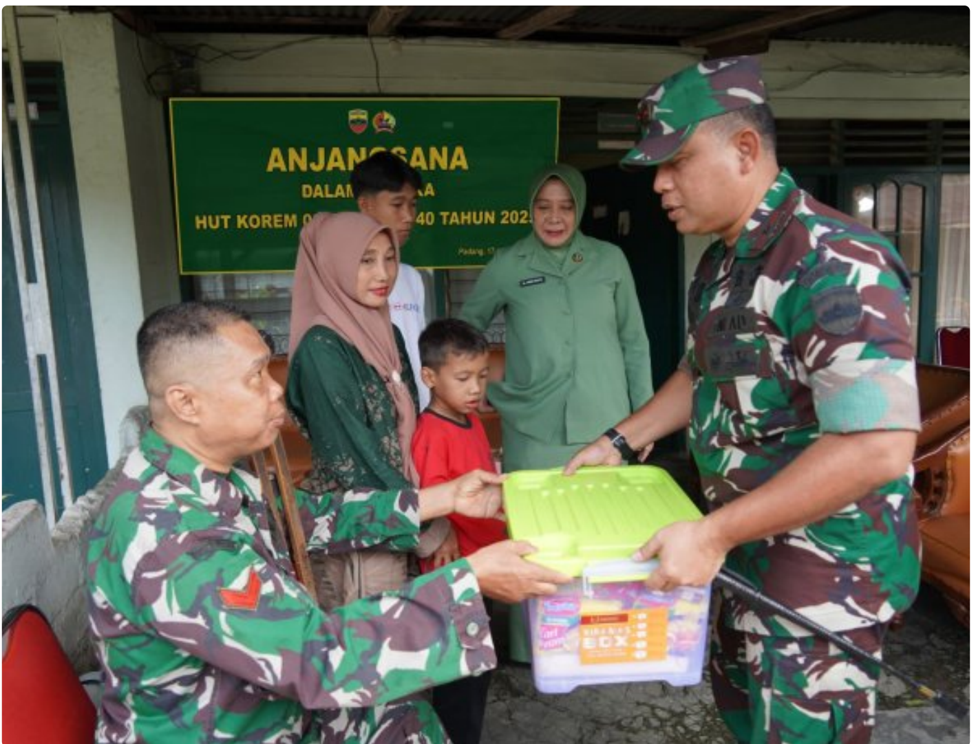
Padang, - Serangkaian kegiatan sosial digelar menjelang HUT ke 40 Korem